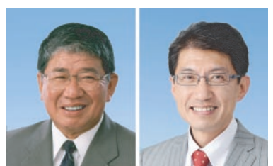
衆議院議員 赤嶺 政賢 田村 貴昭