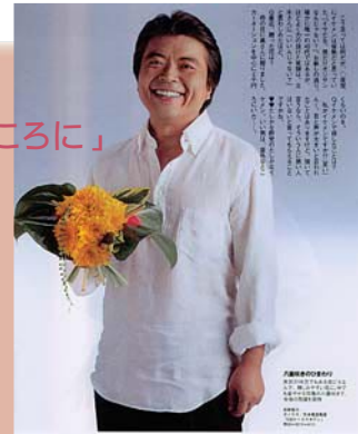
*立木さん = 写真家・立木義浩氏

こう言っては何だが、産党にイケメンは皆無だと思っていた。 ...(中略)...ほどよく力の抜けた笑顔は、立木さんに「いいんじゃない？」と言わしめたほど。...(中略)...いい男は、意外なところにいた...。(週刊朝日 2008年7月25日号)